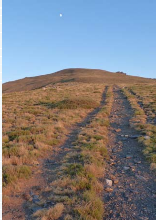
Hábitat del chorlito carambolo, desde Los Asperones.

Abandonando la protección del bosque vislumbramos en la cuerda una serie de resaltes rocosos, Los Asperones, a los que nos dirigimos. Llegados al más alto de los tres, nos desviamos hacia él para efectuar