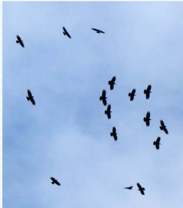
Bajo el Chullo se forman agregaciones de chovas piquirrojas.

Desde el Punto de Encuentro del Puerto de La Ragua, en la explanada del albergue comenzamos eligiendo la primera opción de ambas: la opción oriental que asciende por la Loma del Chullo. Para ello localizamos detrás del albergue el ancho cortafuegos que subiremos por su borde derecho, junto a la línea de bosque de pino silvestre ( Pinus sylvestris ). Los primeros reclamos que llaman nuestra atención son los de un párido, el carbonero garrapinos, que junto al agateador común, exploran las ramas que cuelgan sobre nuestras cabezas. Según ganamos altitud, el vuelo de dos alúridos no pasa desapercibido, la cogujada montesina y la alondra totovía, ambas especies nidificantes en las inmediaciones. A los diez minutos llegamos a una explanada, la Meseta de Prados Altos, dirigiéndonos a unas prominentes rocas desde donde dominamos el paisaje circundante que ahora incluye la loma, la cima del Chullo y el surco intrabético entre Sierra