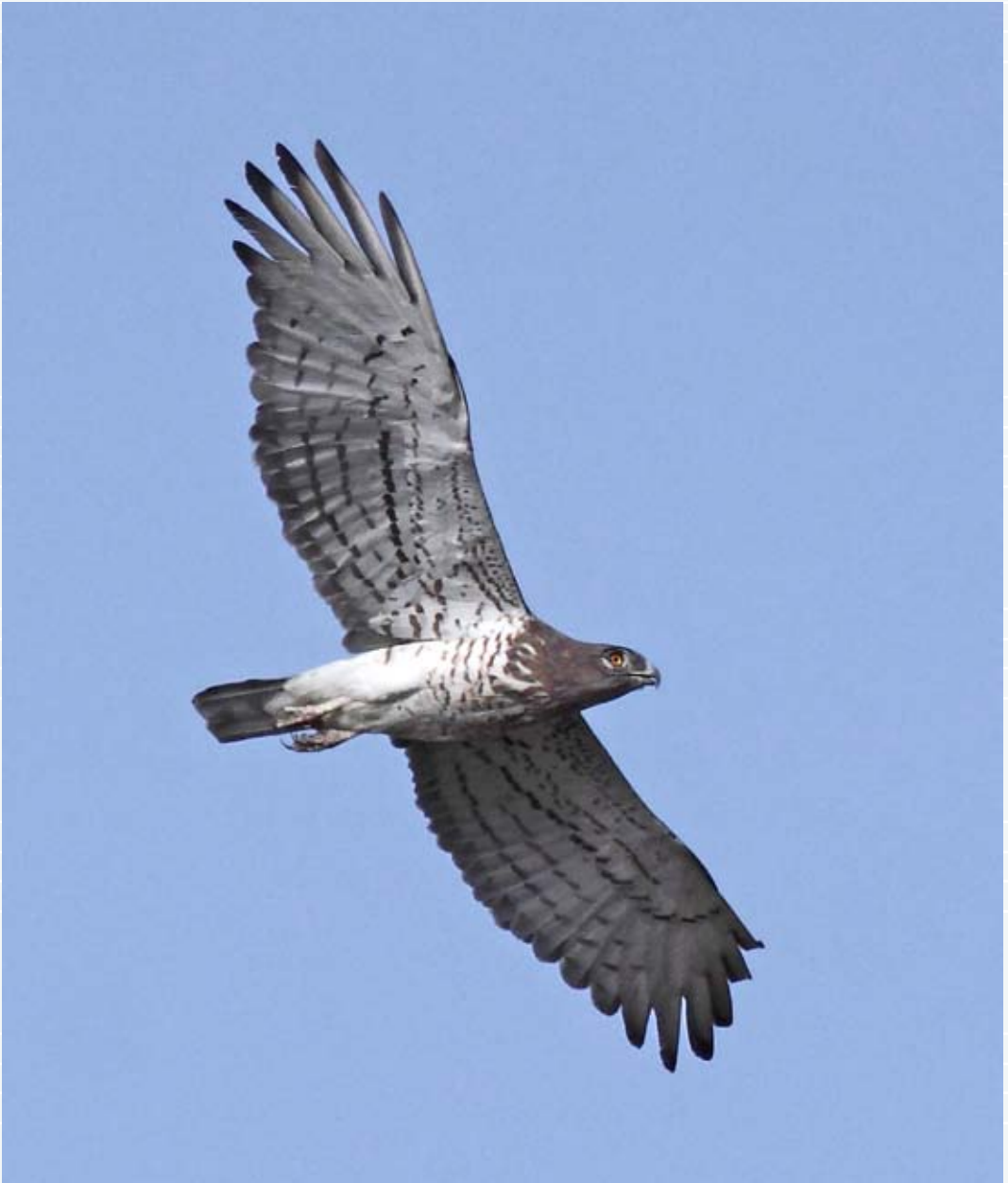
Águila culebrera, una de las rapaces más abundantes en el paso migratorio post-nupcial.

Tras otros seiscientos metros de cómodo ascenso llegamos a una praderas siempre verdes, lugar de nacimiento de las aguas que recoge el arroyo, donde se localizan algunas aves muy interesantes como el escribano hortelano o en el pasado también el bisbita alpino. El lugar es propicio