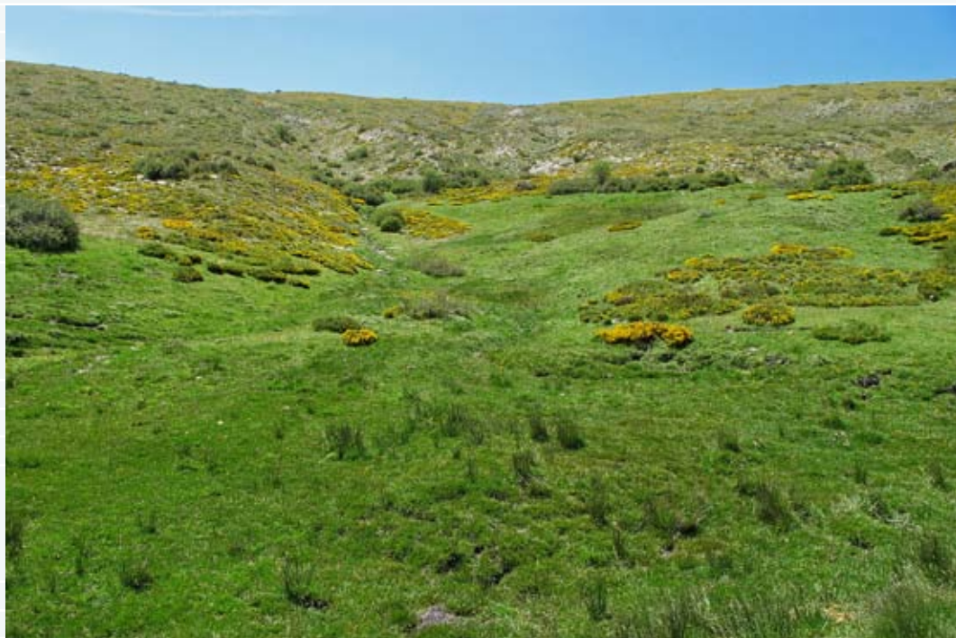
Los borreguiles del nacimiento del Arroyo Majacaco.

migratorio que, procedente de tierras subárticas, le llevará hasta la cercana franja litoral del Cabo de Gata.